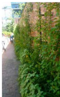
Parc de Bercy - Paris