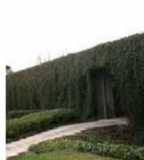
Abords du Parlement Strasbourg