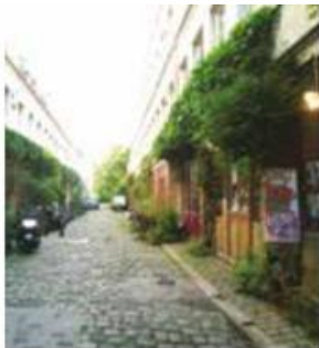
Paris - 11e arrondissement