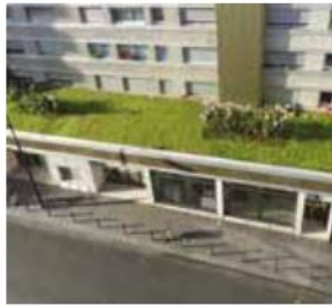
Toiture semi-intensive Hôtel parisien