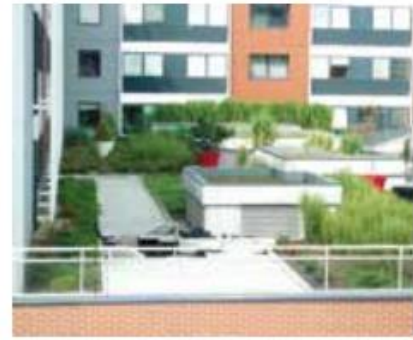
Toiture intensive Immeuble à Rive étoile - Strasbourg

La végétalisation en façade, ou mur végétalisé , est une technique d'architecture écologique qui consiste à recouvrir les murs extérieurs d'un bâtiment avec des plantes. Cette méthode peut inclure l'utilisation de plantes grimpantes, qui s'élèvent le long des murs avec l'aide de treillis ou de supports, ou de murs végétaux, des structures verticales comportant un substrat dans lequel les plantes sont enracinées.