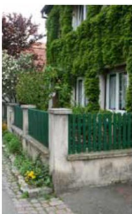
Rue de Fréconruet au Neudorf