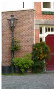
© SB - Eurométropole de Strasbourg