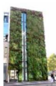
Mur modulaire monobloc de l'École Nationale d'Administration Strasbourg - © TM-SAS