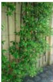
Maison du Jardinage - Paris