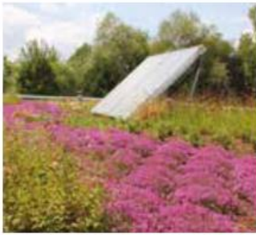
Toiture expérimentale Locaux de la SAS Thierry Muler