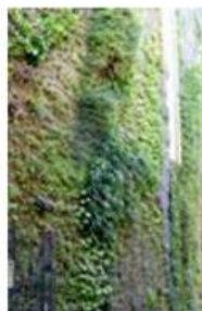
Mur végétal sur mesure Paris