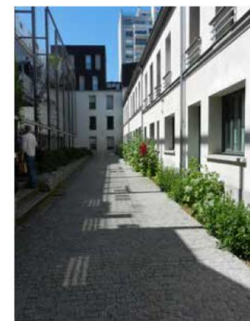
Rue des haies - Paris