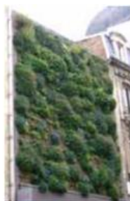
Mur modulaire monobloc Rue de la Veste - Reims