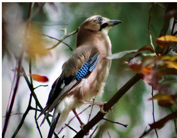
Geai des chênes